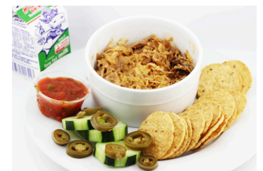
Nachos con carnitas