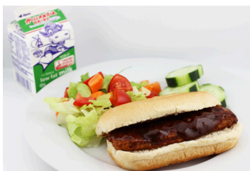
Sándwich de costillas con salsa BBQ