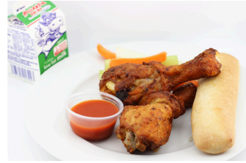
Alitas de pollo asadas al horno o Nuggets de verduras