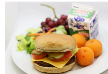
Hamburguesa o hamburguesa con queso