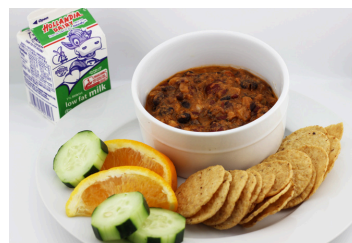
Guiso vegetariano de frijoles con totopos