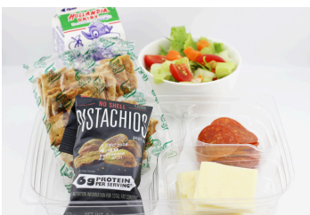
Caja de charcutería