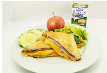
Sándwich de jamón y queso a la parrilla