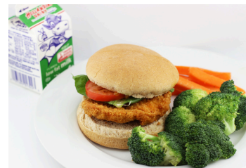
Sándwich de pollo o Sándwich de «pollo» vegetariano