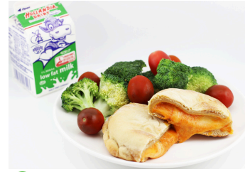
Calzone de queso