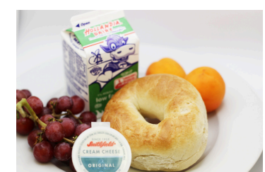
✓ Cuernito de salchicha de pavo y queso o Bagel y queso crema