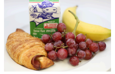
✓ Cuernito de jamón y queso o Bagel y queso crema