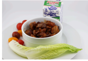
Pollo Teriyaki con arroz