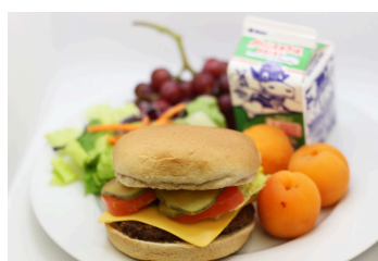
Hamburguesa o hamburguesa con queso