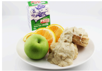
✓ Bisquets y gravy (salsa preparada con jugo de carne) o Pan dulce