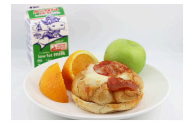
✓ Cuernito de pepperoni y queso o Bagel y queso crema