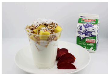
Parfait de yogur