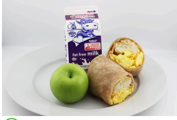
✓ Burrito de huevo, queso y papa frita o Barra BeneFIT