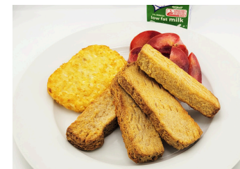
✓ Pan francés con papas ralladas rellenas o Roles de canela