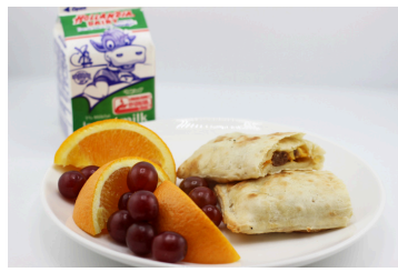
✓ Burrito de salchicha y queso o Barra crujiente de chocolate estilo fogata