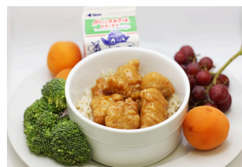
Pollo a la naranja con arroz