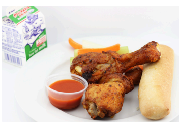
Alitas de pollo asadas al horno o Nuggets de verduras