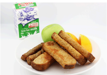
✓ Pan francés con salchichas o Pan dulce