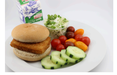
Sándwich de pescado Surfside