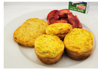
✓ Minitarta de huevo con tocino y queso acompañado de papas ralladas rellenas o Roles de canela