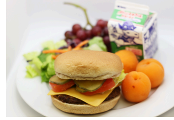
Hamburguesa o hamburguesa con queso