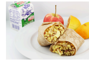
✓ Burrito de tocino, huevo y queso o Barra BeneFIT