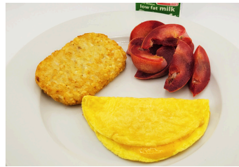
✓ Omelet con tortita de papa o Roles de canela