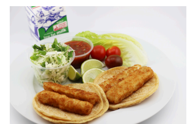
Tacos de pescado