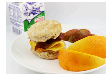
✓ Bisquet de tartita de huevo con queso y tocino o Pan dulce