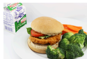
Sándwich de pollo o Sándwich de «pollo» vegetariano