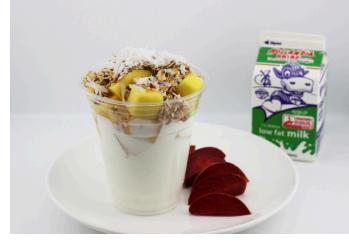
✓ Pizza en pan tostado o Parfait de yogur