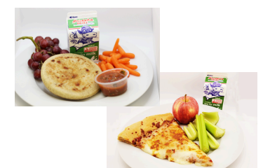
Pupusa de frijoles y queso o Pizza WaveCrest