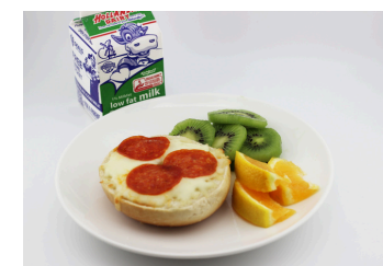
✓ Pizza en un bagel tostado o Parfait de yogur