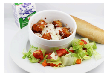
Tazón de pollo a la parricana