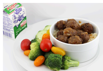
Albóndigas estilo coreano con salsa BBQ y arroz