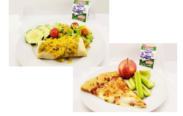
tamal de rajas con queso con semillas o Pizza WaveCrest