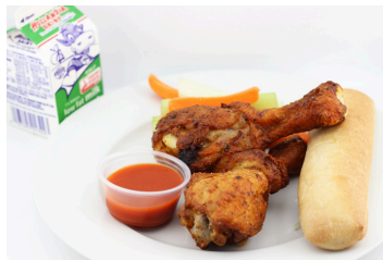
Alitas de pollo asadas al horno