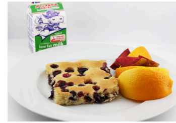
✓ Pan de limón y moras azules o Pizza en pan tostado