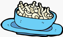
Rotini y salsa de carne