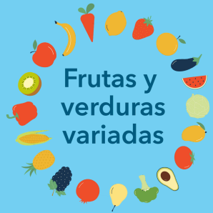
Frutas y verduras variadas